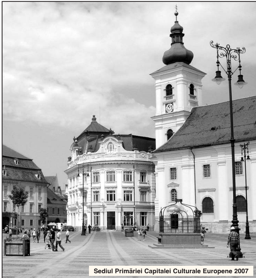
Sediul Primăriei Capitalei Culturale Europene 2007

Monitorizați, criticați, condiționați – până la urmă nu contează, esențial, decât realitatea că am trecut, în mod oficial, pragul Comunității Europene, că suntem la aceeași masă cu națiunile de elită, că am câștigat un statut după care jinduim demult. Bine ar fi ca, pe termen lung, să izbutim din nou performanța de a „speșii” Europa, nu în cele rele, ca până de curând, ci pe planul performanței și competitivității economice. Bine te-am găsit, Europa! Așteptăm vremuri mai bune! („Euroeconomia XXI” nr. 84)