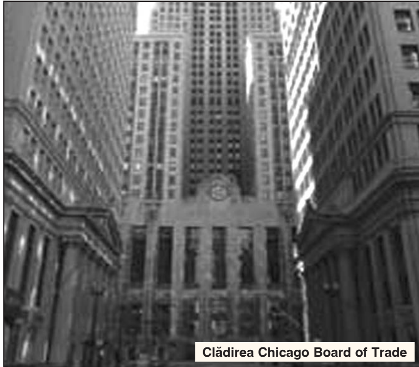
Clădirea Chicago Board of Trade

În ultimii ani, îmbunătățirea activității de supraveghere și corectă informare asupra riscurilor pe care le implică aceste instrumente au readus piețele derivate pe un trend ascendent, majoritatea burselor din acest segment raportând, an de an, creșteri semnificative ale volumelor de tranzacționare. Recunoașterea succesului acestor instrumente este evidențiat de premiul Nobel oferit în 1997 lui Robert C. Merton (Profesor la Harvard University, Cambridge, USA) și Myron S. Scholes (Profesor la Stanford University, Stanford, USA) pentru activitatea inovatoare în domeniul evaluării instrumentelor derivate. Modelul Black - Scholes privind evaluarea opțiunilor este deja consacrat, acceptat și utilizat de majoritatea traderilor pe piețele derivate.