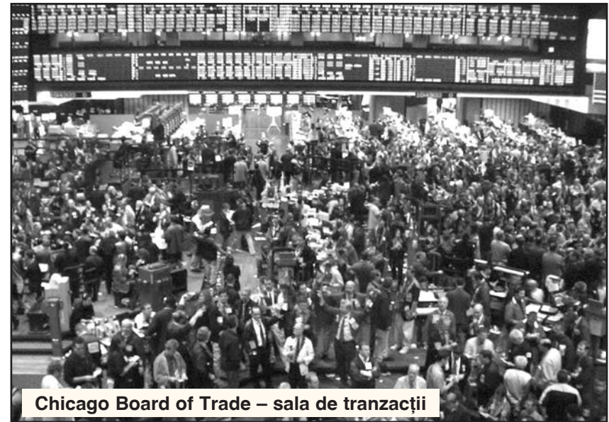
Chicago Board of Trade – sala de tranzacții

OneChicago este o bursă specializată în tranzacționarea contractelor futures pe acțiuni listate pe piața de capital din SUA. A fost înființată și funcționează sub forma unui joint venture între Chicago Mercantile Exchange, Chicago Board of Trade și Chicago Board of Options Exchange. În prezent, 200 de acțiuni ale celor mai importante companii americane sunt listate pe piața OneChicago, iar numărul lor este într-o creștere con-